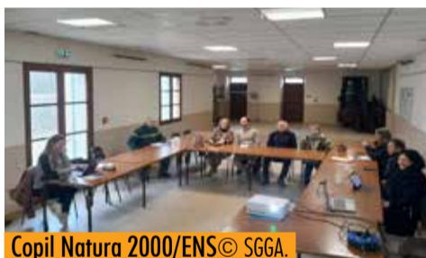
Copil Natura 2000/ENS

Le 21 janvier s'est tenu le Comité de pilotage (COPIL) des sites Natura 2000 « Basse Ardèche » et « Basse Ardèche urgonienne » et de l'Espace Naturel Sensible des Gorges de l'Ardèche et Pont d'Arc, à Saint-Remèze. Exercice annuel, le COPIL réunit une pluralité d'acteurs du territoire (élus, agriculteurs, chasseurs, forestiers, associations, etc.) et permet à chacun de s'approprier les enjeux naturels des sites et de contribuer à la réflexion sur les objectifs et les mesures de gestion.