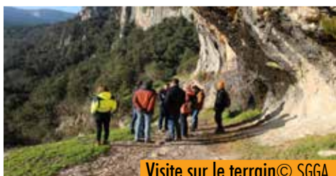
Visite sur le terrain © SGGa.

2014, projet Grand Site de France) ; débattre de la connexion entre le Grand Site de France de l'Aven d'Orgnac et le projet Grand Site de France des Gorges de l'Ardèche ; faire le bilan des actions menées depuis plus de 30 ans sur ce territoire, dont le bilan des aménagements de la Combe d'Arc. Des discussions précieuses pour l'élaboration de la candidature au label !