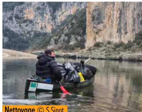
Nettoyage © S.Sinot.

Les épisodes cévenols, bien connus et récurrents, apportent avec eux non seulement de l'eau dans les rivières ardéchoises, mais aussi une multitude de déchets d'origines variées. Le SGGa a organisé, le mardi 21 janvier, une opération de nettoyage d'urgence sur 6 km des berges en rive droite, entre les bivouacs