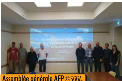
Assemblée générale AFP

Fin 2024, les membres de l'Association Foncière Pastorale des Plateaux (AFP) de la Dent de Rez et de Mézenc se sont réunis lors de leur Assemblée Générale annuelle.