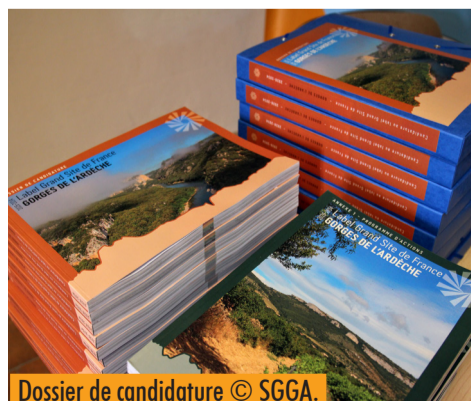
Dossier de candidature © SGGA.

Suite à ce dépôt, plusieurs étapes d'instruction (présentations, visites) se dérouleront tout au long de l'année 2026, avant la décision ministérielle concernant l'attribution du label.