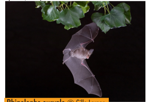
Rhinolophe euryale © Gille Larnac.

Pour assurer sa conservation, le SGGA, accompagné de ses partenaires locaux, met en place des suivis annuels, ainsi que des mesures de gestion et de sensibilisation (pose de panneaux pédagogiques et réglementaires, animations auprès des clubs de spéléo, etc.).