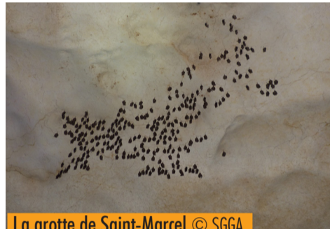
La grotte de Saint-Marcel © SGGA.

Chaque hiver, le SGGA et la LPO réalisent conjointement le suivi des cavités majeures où hibernent les chauves-souris des gorges de l'Ardèche. Les résultats de 2026 sont pour l'instant plutôt encourageants ! Parmi les cavités suivies, la grotte du Dérocs, connue pour abriter la plus grande colonie de Rhinolophe euryale en Rhône-Alpes. Lors du suivi de 2026, 1765 individus ont été recensés : c'est le meilleur effectif dénombré à ce jour depuis 38 années consécutives ! Ce résultat positif peut s'expliquer par les mesures de sensibilisation et communication opérées par les deux structures, avec notamment la pose de panneaux rappelant l'interdiction de pénétrer dans la grotte du 1er novembre au 15 avril pour la quiétude des chauves-souris (conformément à l'arrêté préfectoral). Parmi les cavités historiquement suivies, figure également la grotte de Saint-Marcel. Cet hiver, les résultats se sont avérés également positifs avec des effectifs