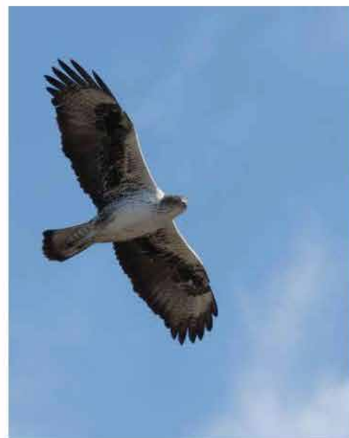
Aigle de Bonelli - © Nicolas Bazin

Elle s'est déroulée hors période sensible pour les rapaces, en présence d'un garde de la Réserve chargé de surveiller le comportement des oiseaux et d'adapter les conditions de vol si nécessaire.