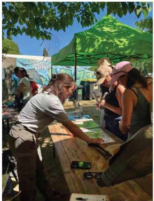
Stand Trail des Gorges

Ce partenariat, outil clef dans la conservation de nos écosystèmes, est à pérenniser pour les années à venir !