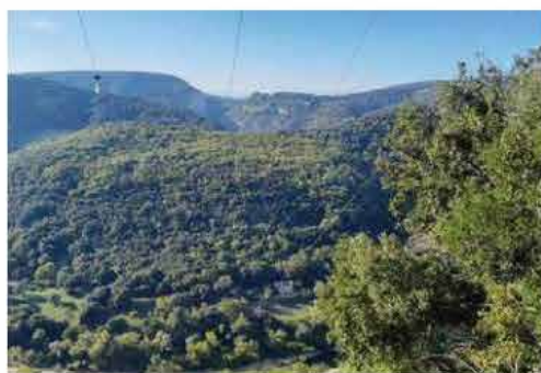
Balise anticollision

En réponse, 23 balises anticollision "Firefly" ont été installées en octobre 2025 sur la ligne électrique de Gaud. Ces dispositifs, fixés en quinconce tous les 15 mètres sur les deux câbles extérieurs, rendent les fils plus visibles et limitent ainsi les risques de percussion pour les grands oiseaux.