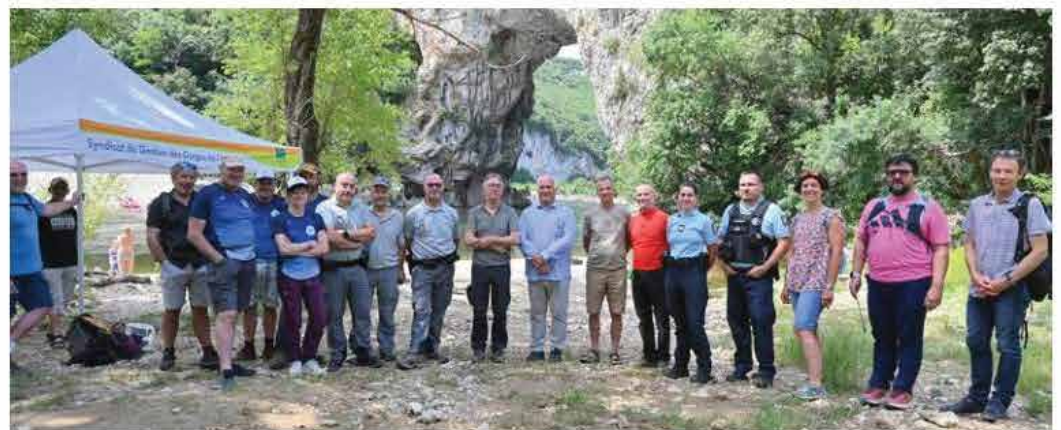
Lancement de saison

randonnée sur la Combe d'Arc et des animations autour de la pêche sur les berges de l'Ardèche. La présentation de l'exposition et du livret poster « L'Esprit des gorges de l'Ardèche » a également eu lieu, dans le cadre du projet Grand Site de France. Une cinquantaine de personnes était présente.