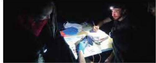
Capture scientifique des chauves-souris dans la grotte des Huguenots

Pour la suite, le SGGA et la LPO AuRa entendent poursuivre les suivis et renforcer la sensibilisation locale pour conserver durablement les chauves-souris, alliées discrètes mais indispensables à nos écosystèmes : elles jouent notamment un rôle important de régulateur d'insectes dits nuisibles et sont de grands consommateurs de moustiques.