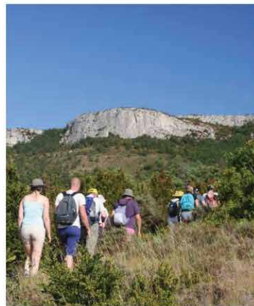
Animation vers la Dent de Rez - © SGGA

Classé site Natura 2000 et protégé par un Arrêté Préfectoral de Protection de Biotope (APPB) depuis les années 1990, le massif de la Dent de Rez constitue un espace naturel emblématique du territoire. L'existence d'une Association Foncière Pastorale (AFP), créée en 2000 et regroupant des propriétaires privés et publics (dont le SGGA), permet de maintenir une dynamique éco-pastorale essentielle à la préservation du site. Cet outil de gestion facilite l'accompagnement des pratiques agricoles tout en contribuant à la conservation des milieux ouverts. En 2025, le SGGA, en partenariat avec la Chambre d'Agriculture, a réalisé un diagnostic pastoral sur les parcelles de l'AFP, avec pour objectif de mieux connaître les ressources fourragères du site et d'améliorer la gestion pastorale.