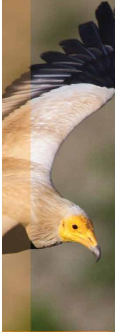
Vautour Percnoptère

nichée repérée dans la réserve naturelle. Le Vautour percnoptère, de son côté, a vu 4 couples se reproduire, donnant naissance à 5 jeunes. L'Aigle de Bonelli a en revanche rencontré plus de difficultés. Parmi les trois couples présents, un seul a réussi à mener à bien sa reproduction. C'est tout