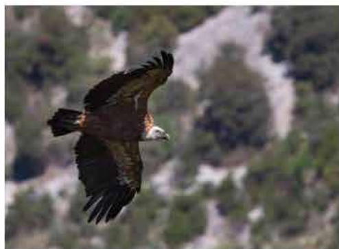
Vautour fauve

Dans la Réserve naturelle des gorges de l'Ardèche, la ligne qui traverse la rivière au niveau du bivouac de Gaud représente une menace avérée : un Hibou grand duc y avait d'ailleurs été retrouvé électrocuté en 2015. Ce risque est d'autant plus préoccupant que la Réserve abrite de nombreuses espèces patrimoniales, dont plusieurs grands rapaces protégés.