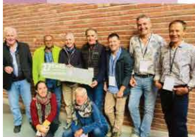
27 e rencontres du Réseau des Grands Sites de France à Dunkerque

gorges, au bivouac de Gaud et dans la Combe d'Arc où un espace de rencontre éphémère a été aménagé; une fresque de mains a été installée à la grotte de la Madeleine. Une série d'oeuvres pour raconter et questionner notre rapport aux gorges de l'Ardèche, uniques. Une balade ponctuée de pauses dessin et écriture, ainsi qu'une soirée contes ont été organisées dans la Combe d'Arc pour le lancement de cette exposition.