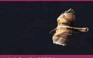
Aigle de Bonelli

Les travaux ont été réalisés par le Comité Territorial Ardèche de la Fédération Française de la Montagne et de l'Escalade (CTFFME 07) au mois de novembre 2025, en dehors des périodes de reproduction de l'Aigle de Bonelli.