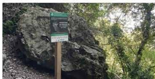
Nouveau panneau d'information réglementaire situé à proximité des cavités Dérocs et Louoi

Depuis les années 2000, le SGGA et la LPO AuRa suivent les populations de chauves-souris dans les Gorges de l'Ardèche, constituant l'un des secteurs karstiques français les plus importants pour la conservation des chiroptères.