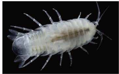
Sphaeromides raymondi