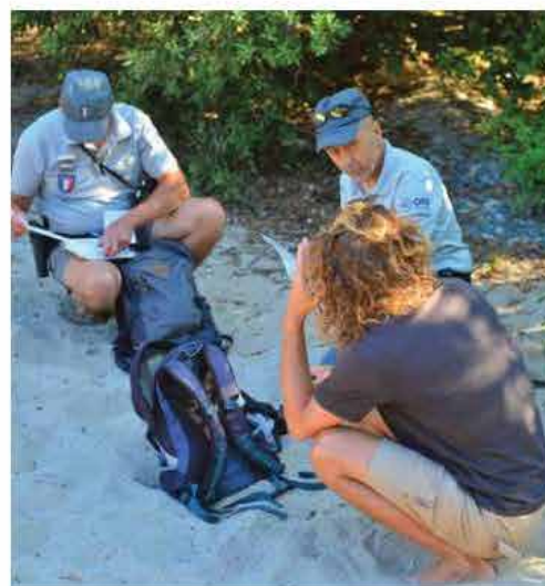
Tournées de surveillance

Les gardes de la réserve assurent toute l'année des tournées de surveillance pour veiller au respect de la réglementation.