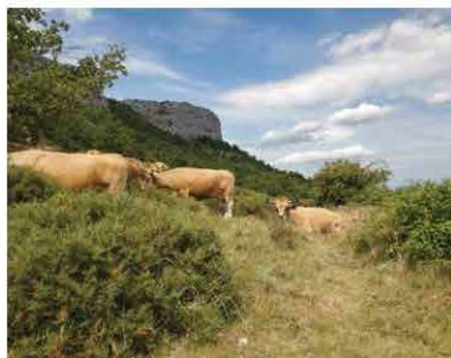
Vaches Aubrac pâturant au pied de la Dent de Rez

Les résultats de ce diagnostic pastoral nécessitent d'être croisés avec un diagnostic écologique. Dès 2026, le SGGA souhaite animer des groupes de travail réunissant l'ensemble des acteurs et usagers du site : AFP, Chambre d'Agriculture, Conservatoire d'espaces naturels, Conservatoire Botanique National, Office National des Forêts, Fédération de chasse, etc. L'objectif est de poursuivre la dynamique collective et de co-construire une gestion concertée, durable et favorable aux milieux naturels, du massif de la Dent de Rez.